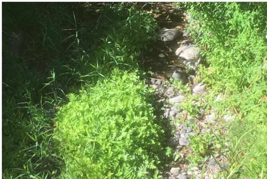
sådan så Torpe Kanalen ud d. 7. august 2018 ved Holmager bro. Normalt er der et vandspejl på 3 meter, her er en vandpyt, vanddybden 2- 5 cm. Nedstrøms og opstrøms var kanaler helt udtørret på lange strækninger.

Grønbæksløbet Svenstrupløbet Dam Renden Kværkeby Bæk Tidseleåen Høm Lilleå Havbyrd Grøften Øllemosebæk